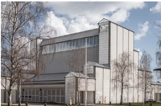
Figur 1. Bagsværd Kirke fra Taxvej

Formsproget er enkelt og stramt, med en facade af glatte, hvide betonfliser, og kirken er kendetegnet ved dens indre smukke skulpturelle loft, som giver kirkerummet et helt særligt lys og en bemærkelsesværdig lyd.