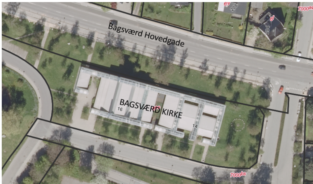
Figur 2. Den lange matrikel som Bagsværd Kirke ligger på